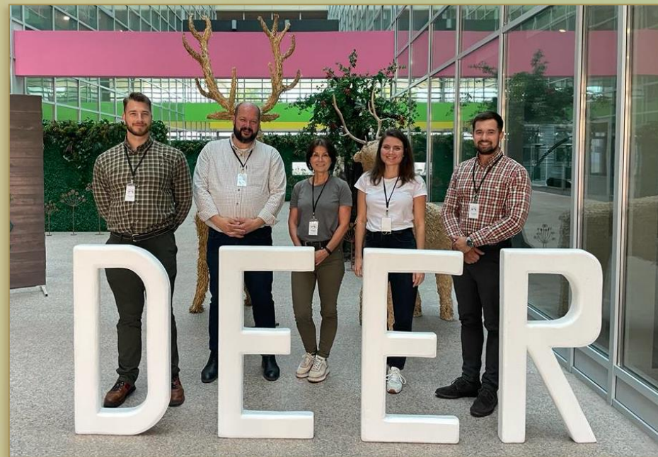
X. Nemzetközi Szarvasbiológiai Konferencia 2022

Saját tudományos munka bemutatása (poszter / előadás)